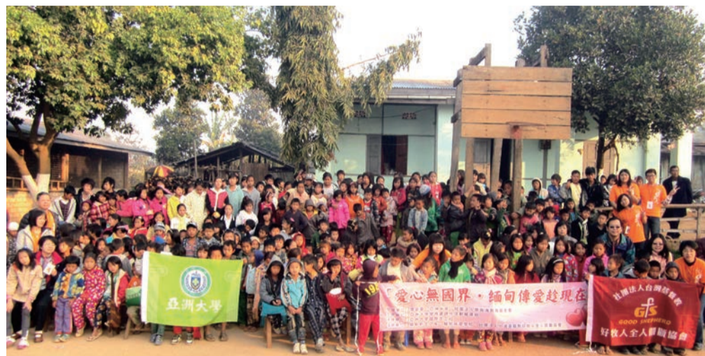
▲ 亞洲大學國際志工寒假在緬甸臘戍展開志工服務，與緬甸嗎哪小學300多位師生大合照。

送你出國 ① 當交換生 ② 留學 ③ 實習生 ④ 論文發表 ⑤ 發明比賽拿金牌 ⑥ 當國際志工