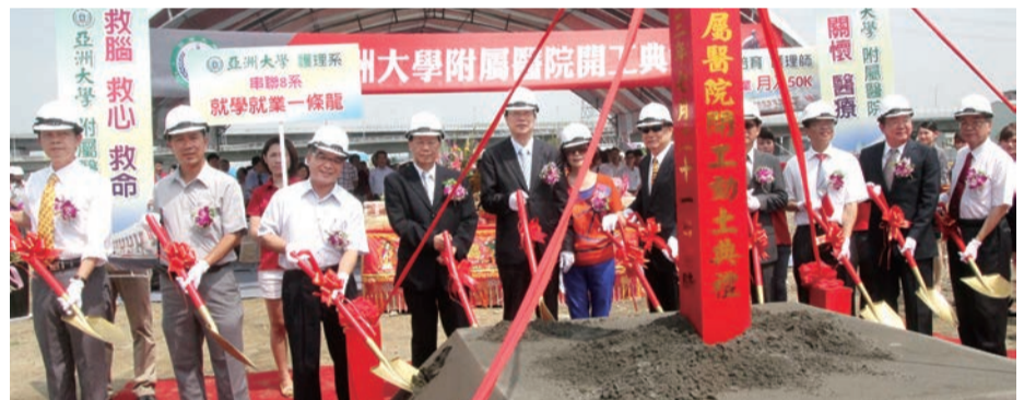
▲亞大附屬醫院動土，預計明年底完工，提供霧峰、太平及鄰近南投縣、彰化縣等地區醫療救護所需。