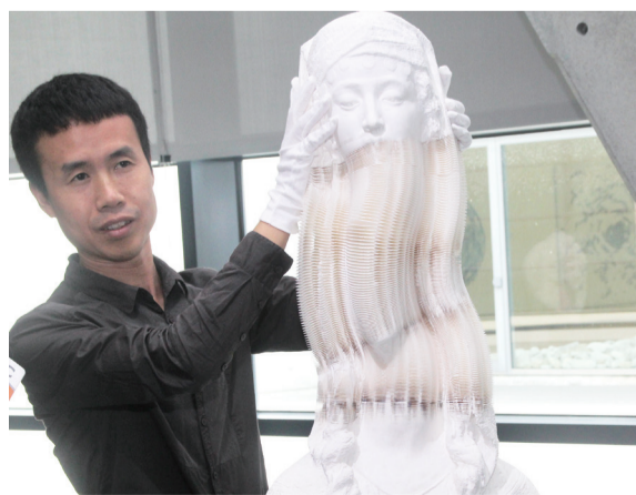
▲中國藝術家李洪波作品看似石膏雕塑，實則可以任意拉長變形的紙雕塑。

亞洲大學邀請普立茲克獎、日本建築大師安藤忠雄，設計興建亞洲現代美術館，歷經6年半，成功挑戰罕見困難的三角形建築設計，也達到世界最高規格的大阪「清水模工法」標準。館內的三角光影與安藤忠雄設計日本教堂的十字架光影，有異曲同工之妙，呈現建築藝術之美。