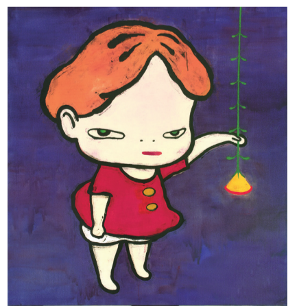
▲日本藝術家奈良美智的「燈花女孩」作品。