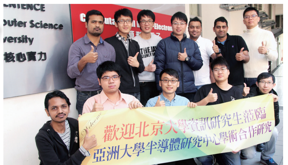
▲北京大學軟件與微電子學院碩士生，分批到亞大半導體研究中心，與國際學生、亞大碩士生一起研究半導體元件製程。

此外，美國杜蘭大學陳榮邦教授每年都帶領一班研究生，考察台灣醫療、健保業務，並與亞大研究生合班開課；健管系主任葉玲玲說，亞大與杜蘭大學連續8年互訪交流，與德州農工大學學術交流也進入第2年。2015年6月，清華大學美術學院院長魯曉波也到亞大進行學術交流。