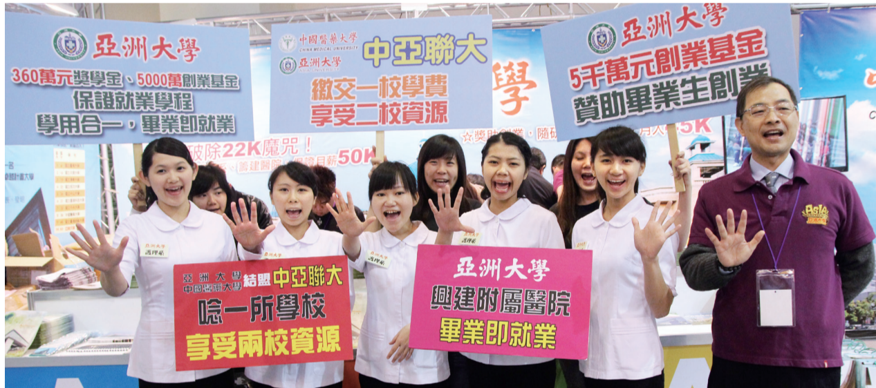
▲「中亞聯大」中醫大、亞洲大學聯盟，教學、研究合作，圖為兩校師生聯合招生。